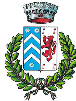
COMUNE DI VERRAYES