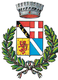
COMUNE DI TORGNON