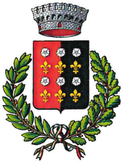
COMUNE DI NUS